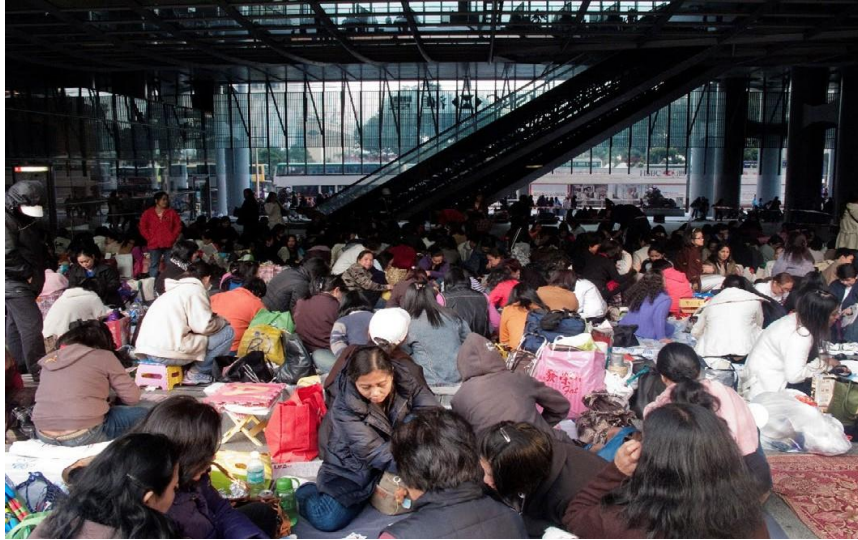
Fotografía del proyecto Ellas, filipinas , 2010-2013. Colección particular

La presente antológica en Bilbao subraya que, aunque la artista se movió entre Madrid y Estados Unidos, su obra no dejó de conversar con el territorio vasco. Su práctica durante estos años reescribe historias locales, en Bilbao y Bizkaia, dentro de debates globales sobre trabajo, género, técnica y memoria.