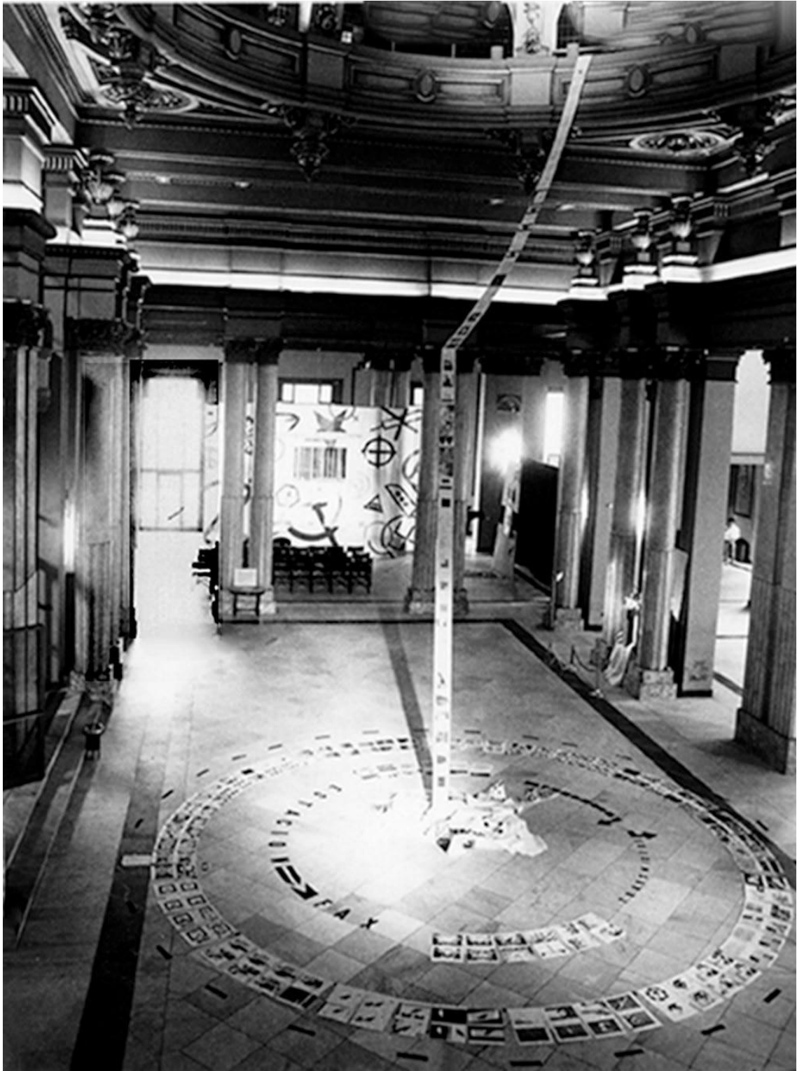
Instalación Estación fax / Fax Station , Círculo de Bellas Artes, Madrid, 1993.