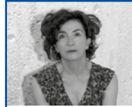
Matxalen Bilbao Koreografoa eta dantzaria