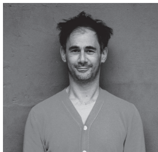
JÉRÔME BEL (Montpellier, 1964)

Piezak «sintonia handia du espazioaren arimarekin, Azkuna Zentroaren sorkuntza garaikiderik gaurkoena gauzatzeko», nabarmentzen du La Fundación-ek.