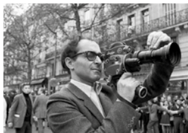
Jean-Luc Godard Esperimentatzeko artea Zinemateka