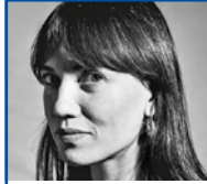
Ana Vaz Artista eta zinemagilea