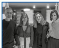
Urbanbat Azkuna Zentroko Kolektibo Egoiliarra