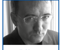
JL Moraza Komisarioa eta artista