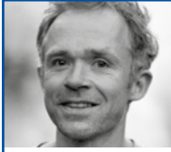
Ben Rivers Artista eta zinemagile esperimentalak