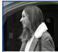
Ane Pikaza Artista