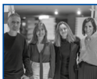
Urbanbat Colectivo Residente en AZ