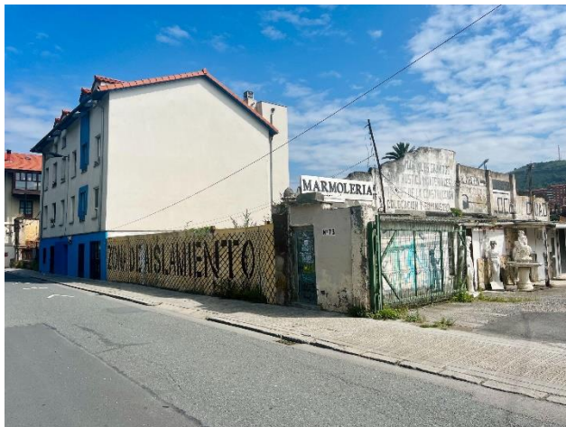
5. ir. "Isolamendu Eremua" horma-irudia Marmoleria Ercor Stone-ren fatxadetan, Deustuko Erribera 73, Bilbo. 2019.