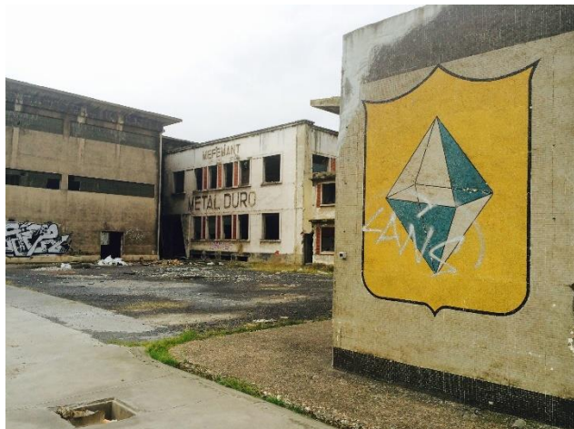
4. ir. Mefesa fabrika zaharra, industria-ondare gisa katalogatua, gaur egun aurri-egoeran. Zorrotzaurre uhartera 2017.