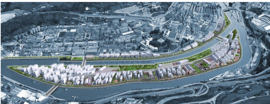
2. ir. Zorrotzaurre uhartea, Bilbo. Zaha Hadidek Zorrotzaurrerako diseinatutako hiri-berroneratzeko proiektuaren 3Dko irudia.