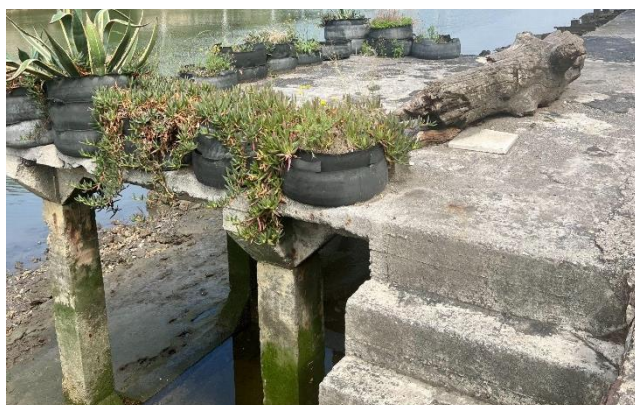
8. ir. Erabilera publikoko espazioa, Bilboko Zorrotzaurreko Erriberako 4. zenbakiko bizilagunek sortua. 2020.