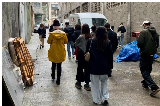
9. ir. Europako kultura-eragileen bisitak Artiach fabrika zaharraren barruko lokaletara / erabili gabeko pabilioietara / jardueretara. 2022. https://espacioopen.com/visitas/