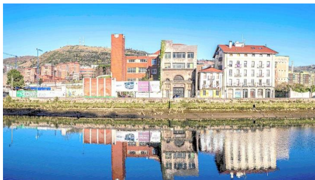
6. ir. Bilboko galleta-fabrika zaharra, Artiach fabrika, industria-ondare gisa katalogatua, Deustuko Erribera 70, Zorrotzaurre uhartera, Bilbo. Gaur egun ekosistema emankorra da, eta, bertan, industria tradizionalak eta sormen- eta kultura-industriak daude elkarrekin. 2021. Fotografia: Artxibo propioa. https://espacioopen.com/nosotras/