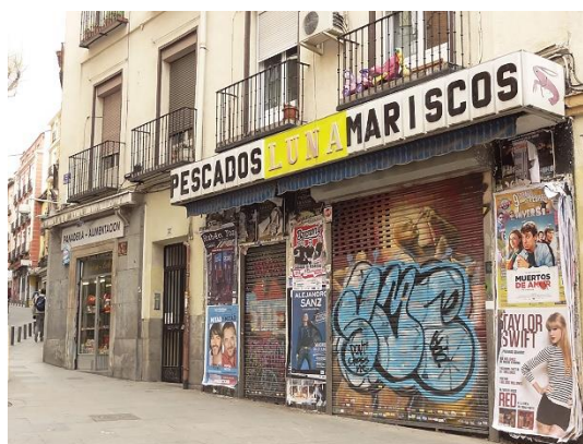
5. ir.: Todo por la Praxis . Gentrificatour. Madril, 2013.