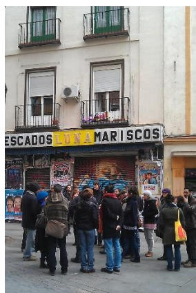
6. ir.: Todo por la Praxis . Gentrificatour. Madril, 2013.