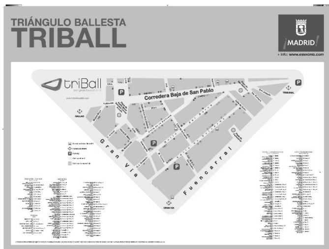
1. ir.: Madrilgo Udala. Triball merkataritza-gunearen mapa. Madril, 2010.