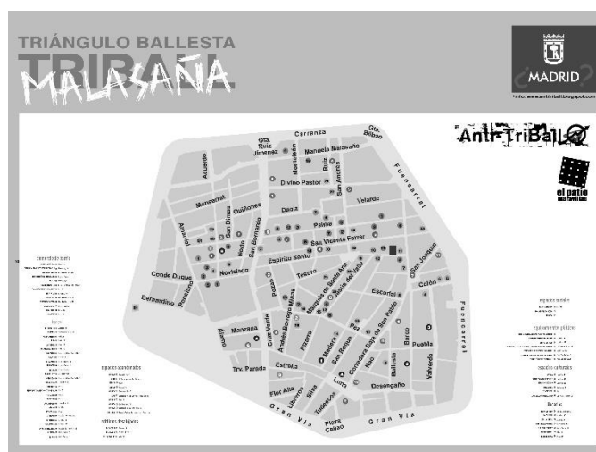
2. ir.: Todo por la Praxis . Mapa alternatiboa. Madril, 2010.