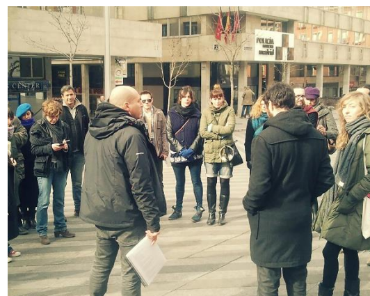
7. ir.: Todo por la Praxis . Gentrificatour. Madril, 2013.