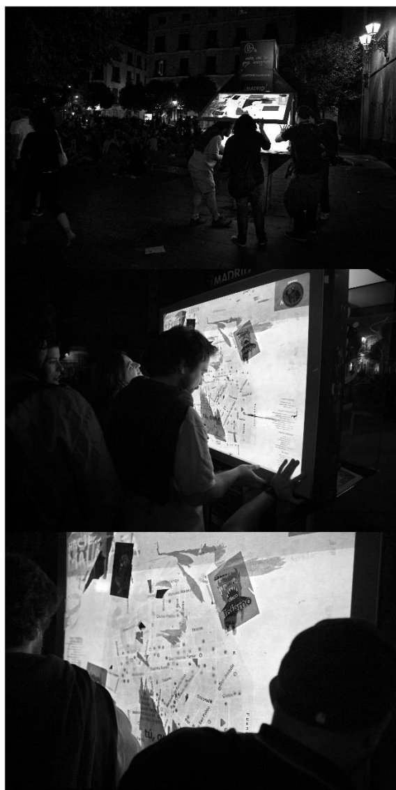
3. ir.: Todo por la Praxis . Jatorrizko maparen ordeztu mapa berria jartzeko ekintza. Madril, 2010.