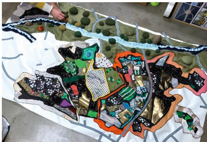
El Gran Textil