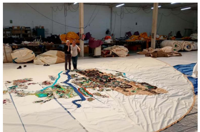
El Gran Textil. Prozesua