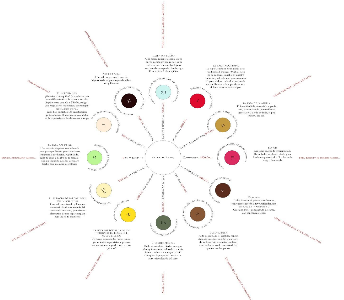
THE TIME MACHINE SOUP