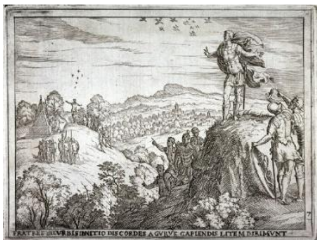
The Brothers, Disputing Over the Founding of Rome, Consult the Augurs, pl.7 from the series The Story of Romulus and Remus. 1575