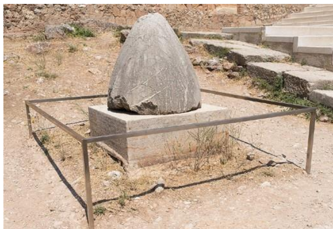
Delphi, Greece. The Omphalos of the Via Sacra. According to the ancient Greek mythology, this is the landmark of the center of the World. Licencia Creative Commons.