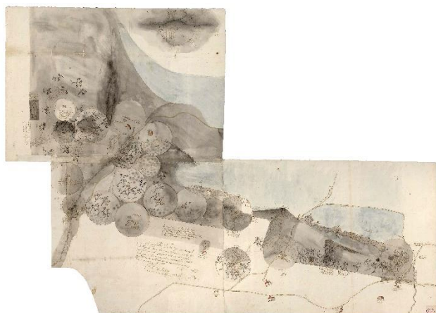
Nabarnizko elizateko termino eta korten mapa (Bizkaia), 1767. Espainia: Kultura Ministerioa. Real Chancillería de Valladolid artxiboa. PLANOAK ETA MARRAZKIAK. BANAKAPENA- BI 0482.