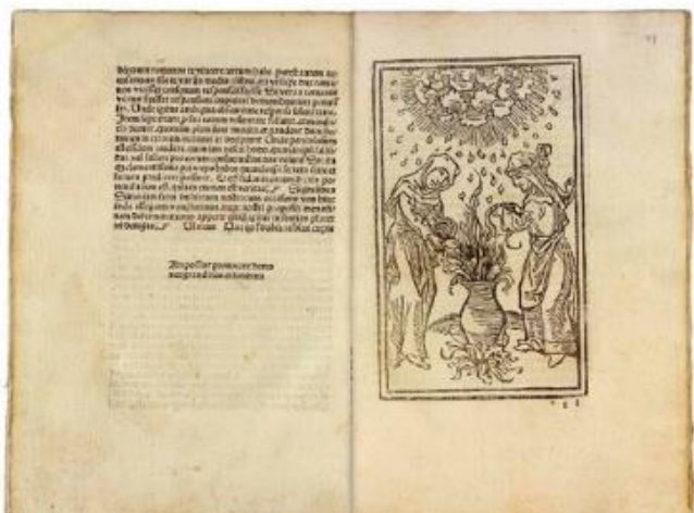
Molitoris, Ulricus. De Ianiis et phitoniceis mulieribus Teutonice vnholden vel hexen, (Reutlingen- Otmar, 1489), fol. 15r.