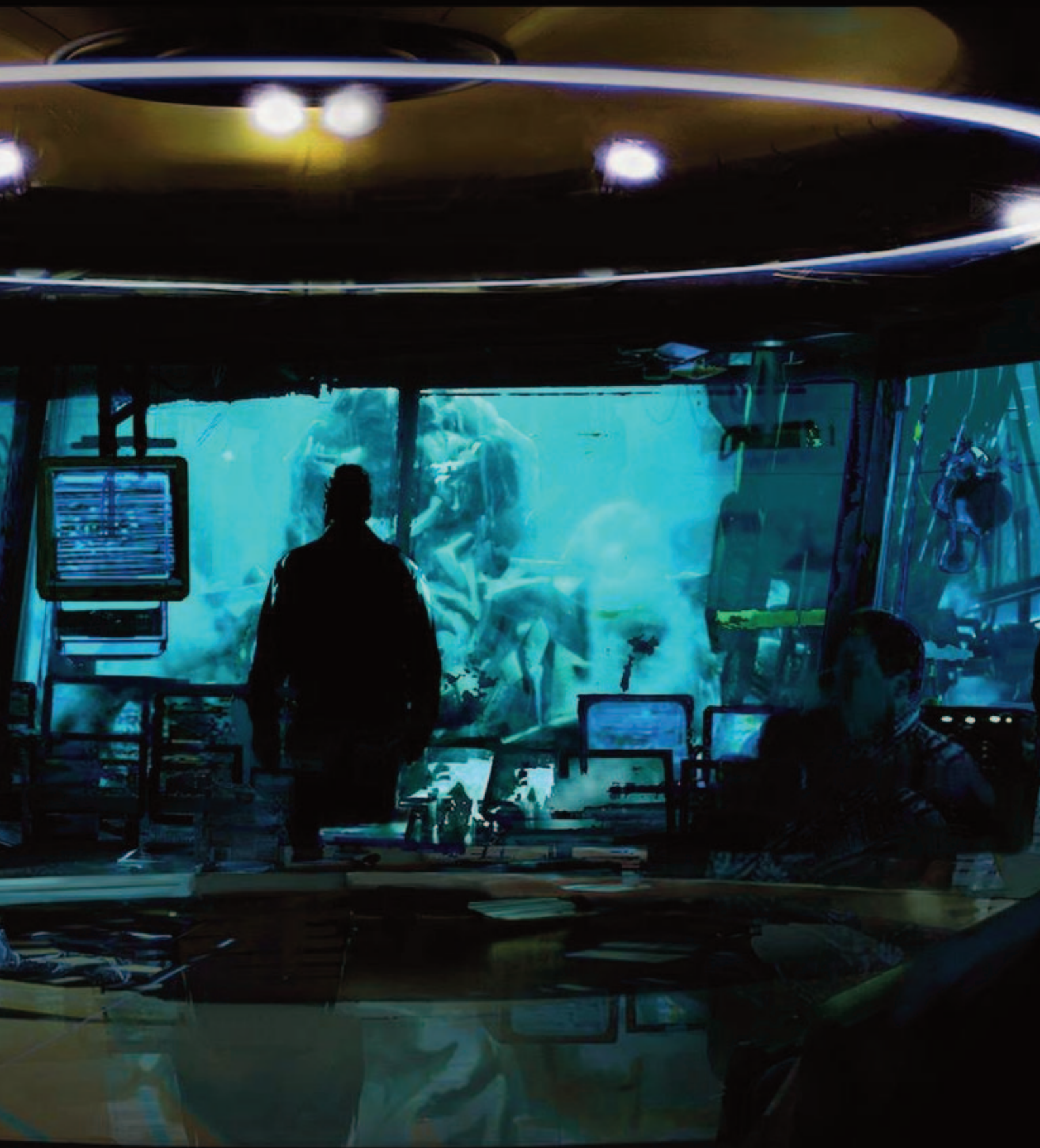
Bumblebee: Situation Room Sketch 5 (2017) Artista: Thomas Pringle