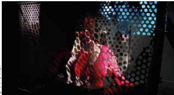
Ágil y un placaje

18:00-20:00h Materialak erakustea eta lan-prozesua Sala Fernández del Campo