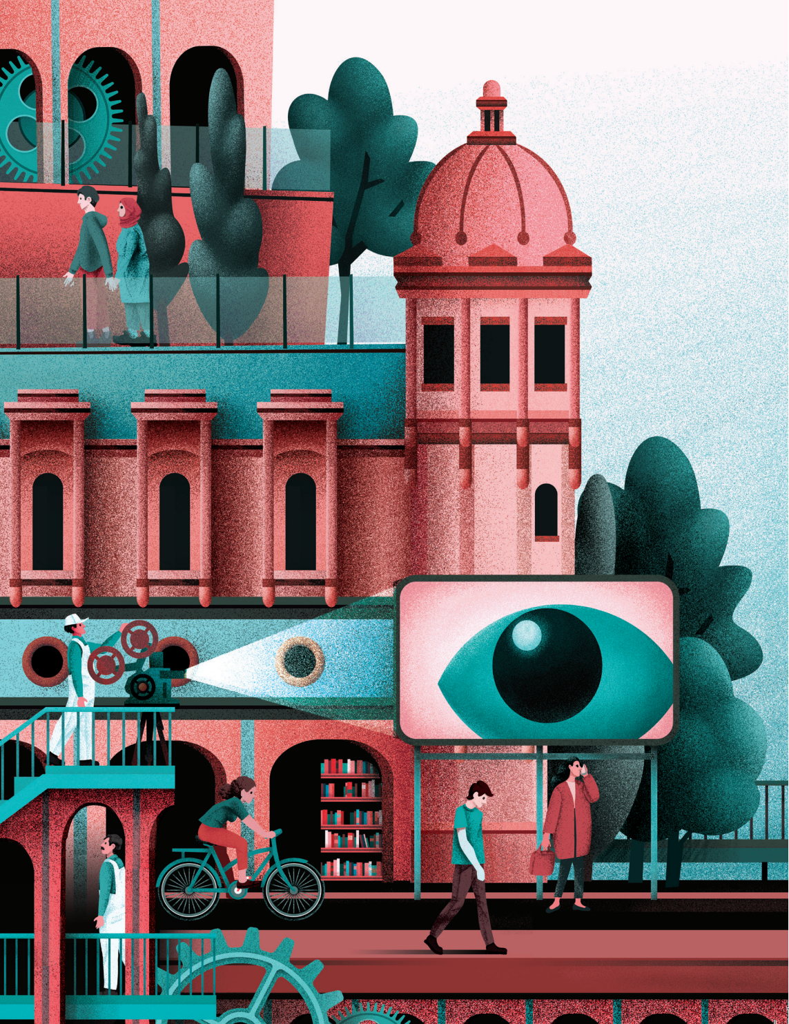
Azaleko irudiak: Tomo Estudio