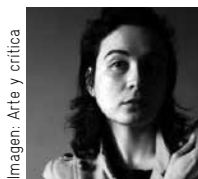
Imagen: Arte y crítica

imágenes que señalan la manera en la que se ha construido iconográficamente la historia cultural del País Vasco a través de un objeto concreto: el hacha. Este álbum ha considerado tanto aspectos formales, como simbólicos, sociológicos, biográficos, filmicos incluso animistas del hacha, creando un cuerpo de referencias que serán apuntaladas a través de la escultura.