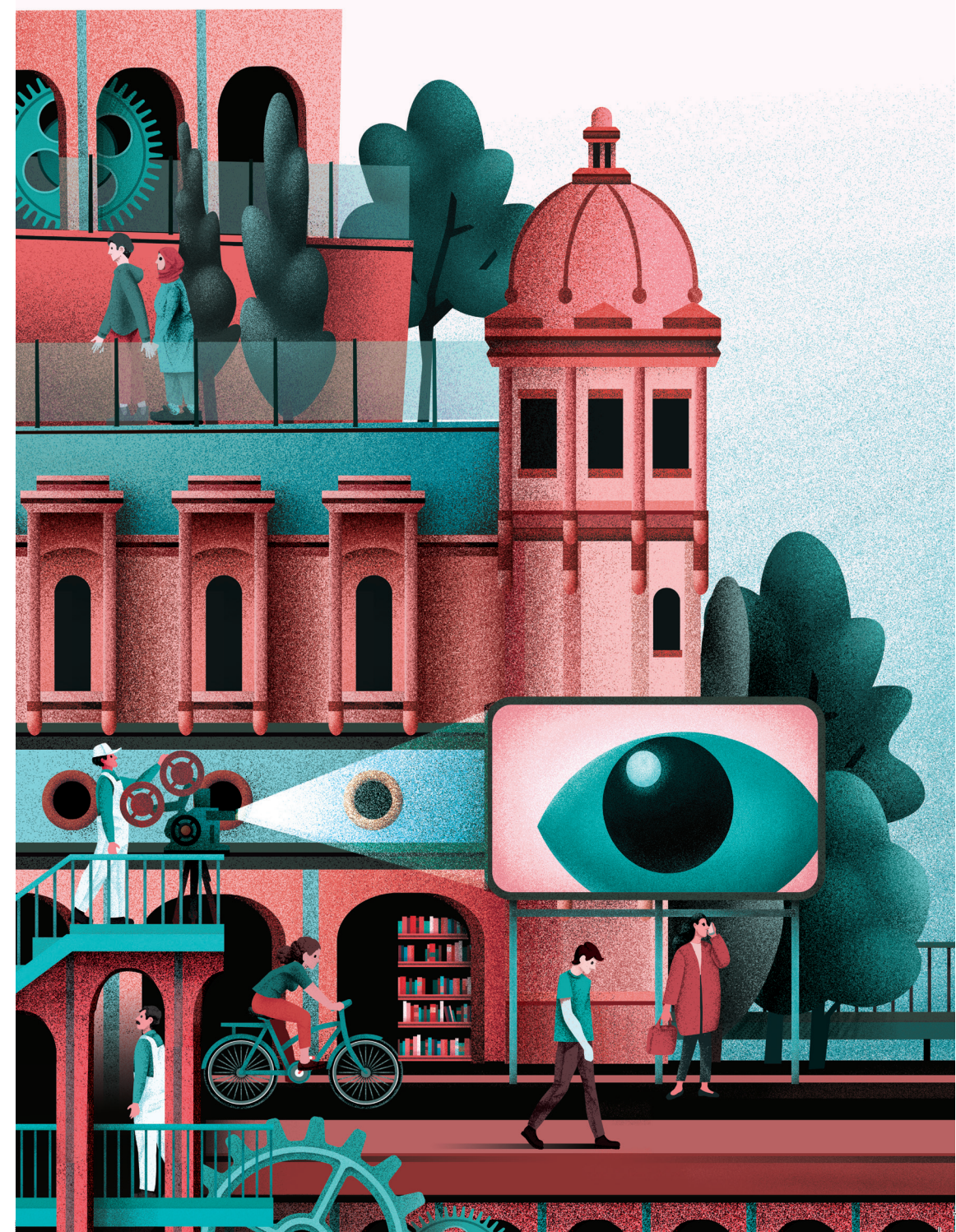
Imagen de portada: Tomo Estudio