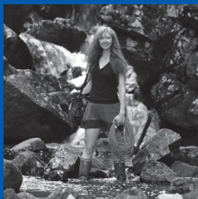
Arg.