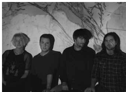
Testura. img: Nora Alberdi