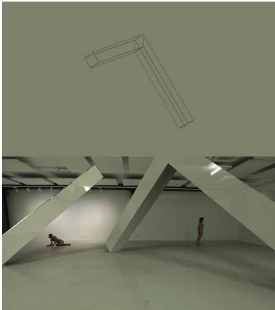
Manu Arregui, 'Ángulos rectos' (2021), stills de vídeo, producido por Azkuna Zentroa en el contexto de 'Un deseo de forma'.