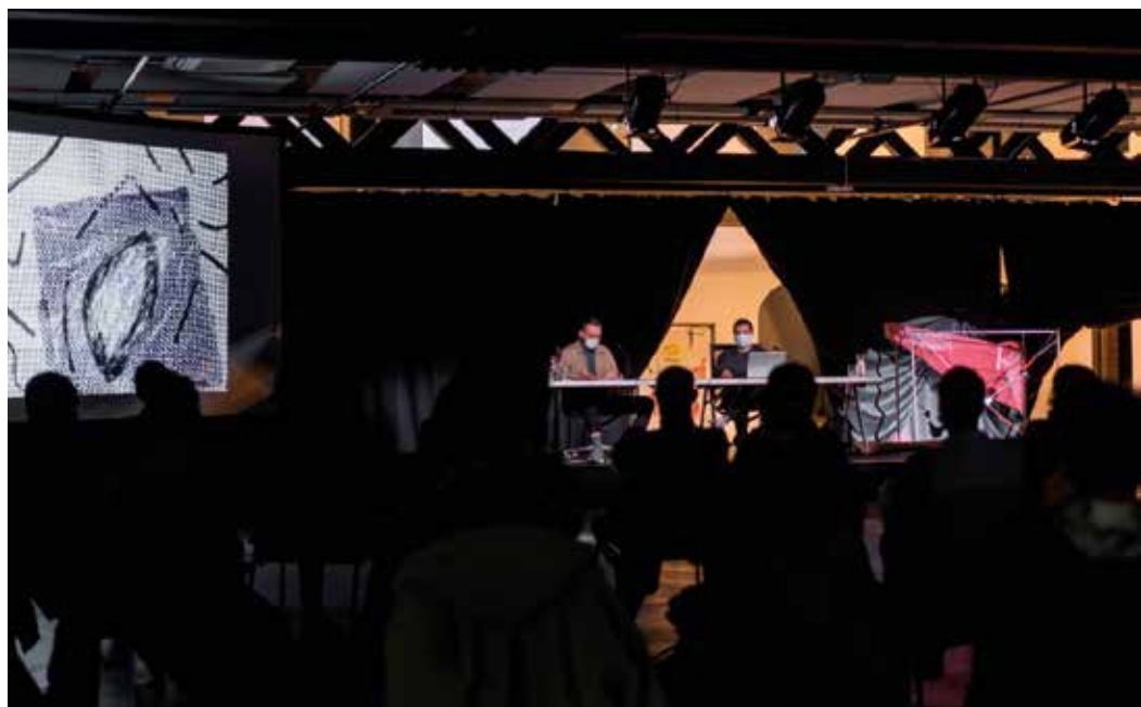
Un deseo de forma, actividad inaugural

interpretación. En el ámbito de la teoría crítica y las ciencias sociales, lo queer/cuir se describe como una perspectiva que cuestiona las convenciones sociales sobre la masculinidad y la feminidad, desnaturalizándolas y buscando un diálogo entre el pasado y el presente de las luchas feministas, LGBTQI+, anti-racistas y