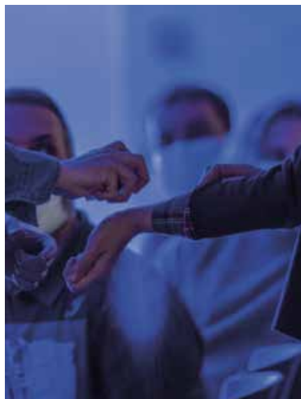
Un momento de la sesión de Sands Murray-Wassink para Un deseo de forma

La cita de noviembre tuvo como invitado a Sands Murray-Wassink , figura de culto queer en la escena artística de Ámsterdam, quien ofreció una presentación sobre su práctica, deudora con el legado del arte interseccional feminista y queer. Murray-Wassink se define como pintor, artista del cuerpo y coleccionista de perfumes. Su sesión para Un deseo de forma tomó una forma híbrida entre la ponencia y la performance, y concluyó con una acción prolongada de pintura en vivo. Así describe Arriola lo sucedió allí: “una nube de perfume envolvió el espacio y a los cuerpos durante la performance de Sands. El uso concreto de perfume en un momento de la acción, así como la energía creada entre el artista y lxs que acudimos a su llamada, generó una envoltura afectiva