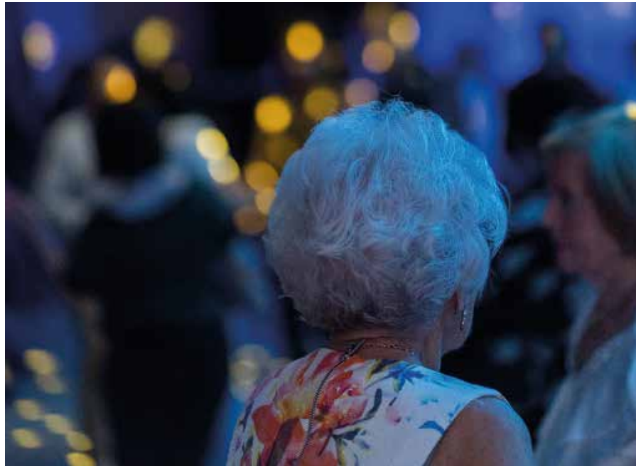
Sra. Polaroiska. No hay edad para el ritmo. Azkuna Zentroa 2019