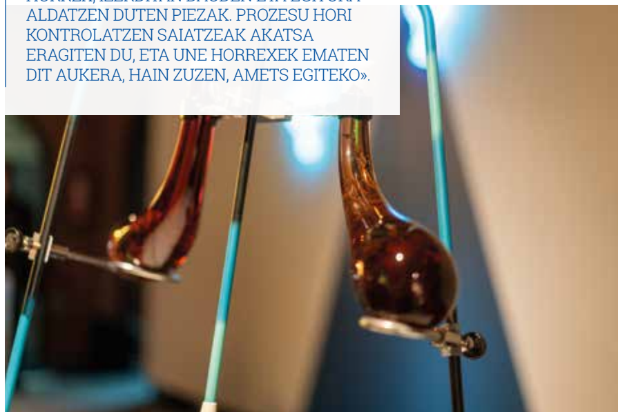
Resina, brea y glicerina

«ERRONKETAKO BAT IZAN DA MATERIAL BIZIEKIN, GORABEHERATSUEKIN ETA MUTATZEN DIRENEKIN LAN EGITEA. ERAKARRI EGITEN NAU ZAURGARRITASUN HORREK, IZERDITAN DAUDEN ETA EGITURA ALDATZEN DUTEN PIEZAK. PROZESU HORI KONTROLATZEN SAIATZEAK AKATSA ERAGITEN DU, ETA UNE HORREXEK EMATEN DIT AUKERA, HAIN ZUZEN, AMETS EGITEKO».