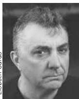
Manuel Vilas Barbastro, 1962 LITERATURA