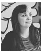
Susanna Inolada Banyeres del Penedés, 1983 GRABADO