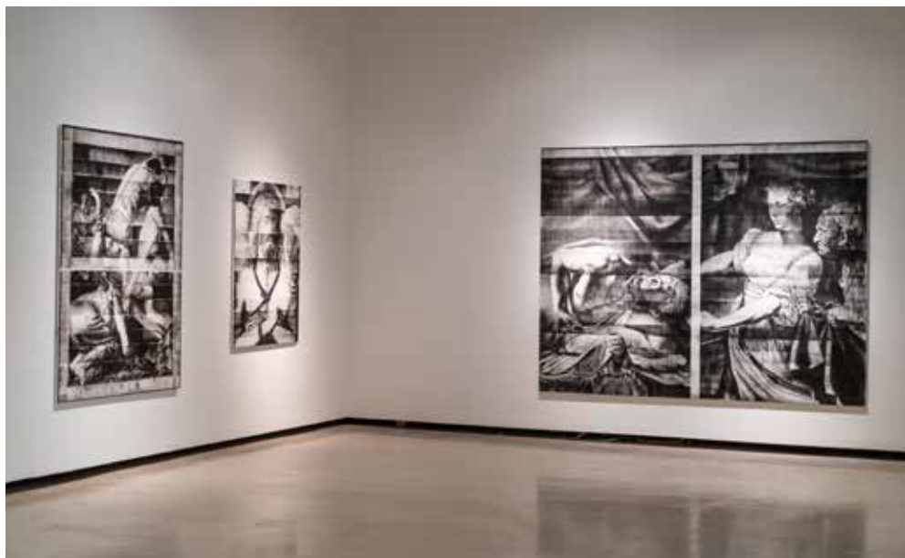
José Ramón Amondarain. Pentimenti (lo posible)