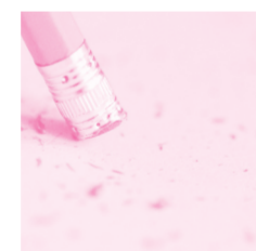
Borrako- mak Gomas de borrar