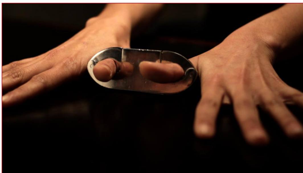
Video Still. Avalon (2011), Maryam Jafri