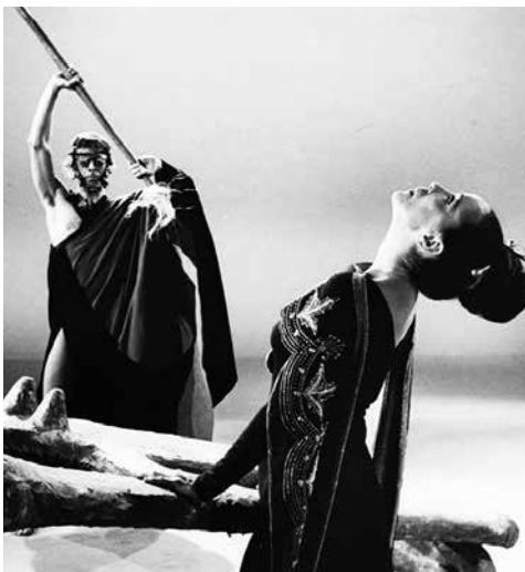
Martha Graham y Alexander Hammid. Night Journey , (1947-1961, 28')

MARTHA GRAHAM ETA ALEXANDER HAMMID Night Journey , 1947-1961, 28' Banaketa Distribución: Centre national de la danse Cortesía de 'Martha Graham Center of Contemporary Dance, Inc'-en eskaintza