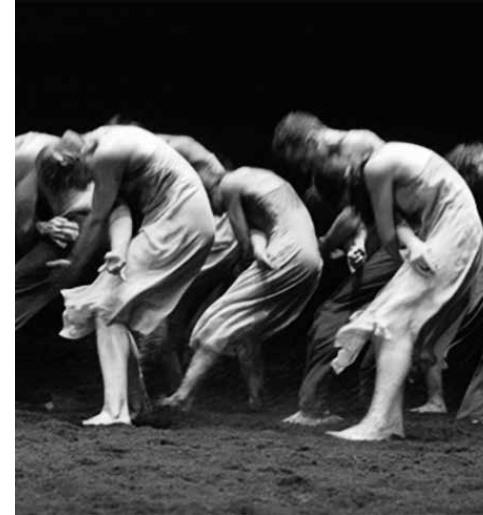
MAURICE BÉJART Le Sacre du Printemps, 1971, 36' Banaketa Distribución: Sonuma