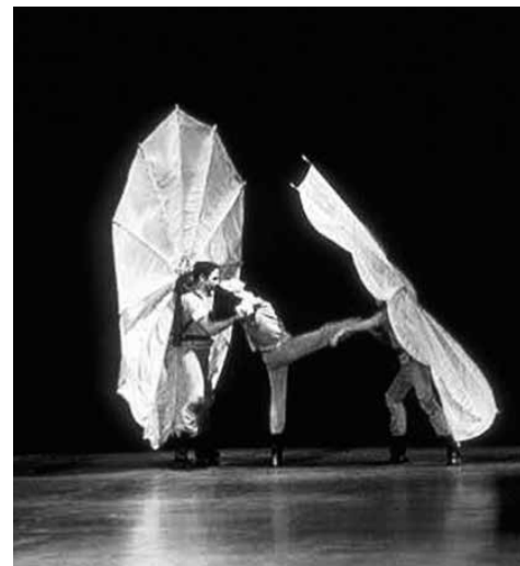
Roberts Rauschenberg. Pelican. Película, 1963.