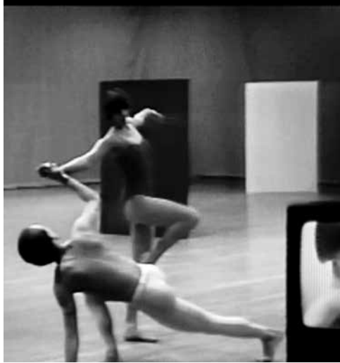
MERCE CUNNINGHAM Y CHARLES ATLAS Blue Studio: Five Segments, 1975-1976, 15'38" Banaketa Distribución: Electronic Arts Intermix (EAI), Nueva York