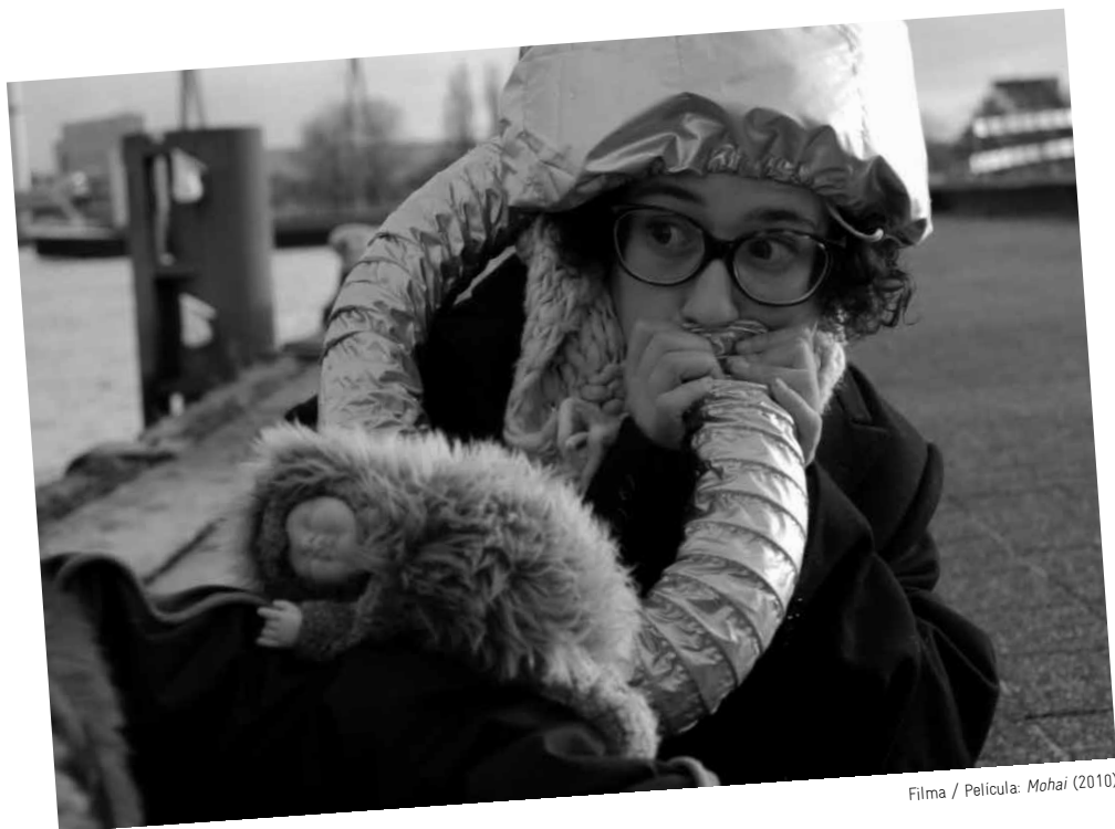
Filma / Película: Mohai (2010)

Ciclo de cine de ciencia ficción, utopías y distopías sobre nuestra realidad en la era post-digital, enmarcado en la exposición Open Codes. We are data