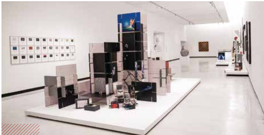
Una línea de tiempo. Era hipermoderna