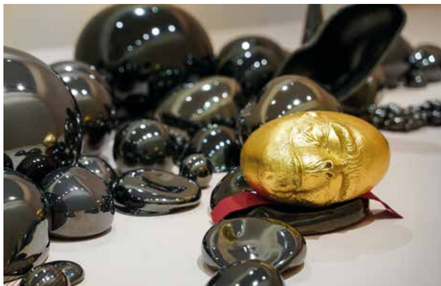
Natura hila perla beltzekin (2002)