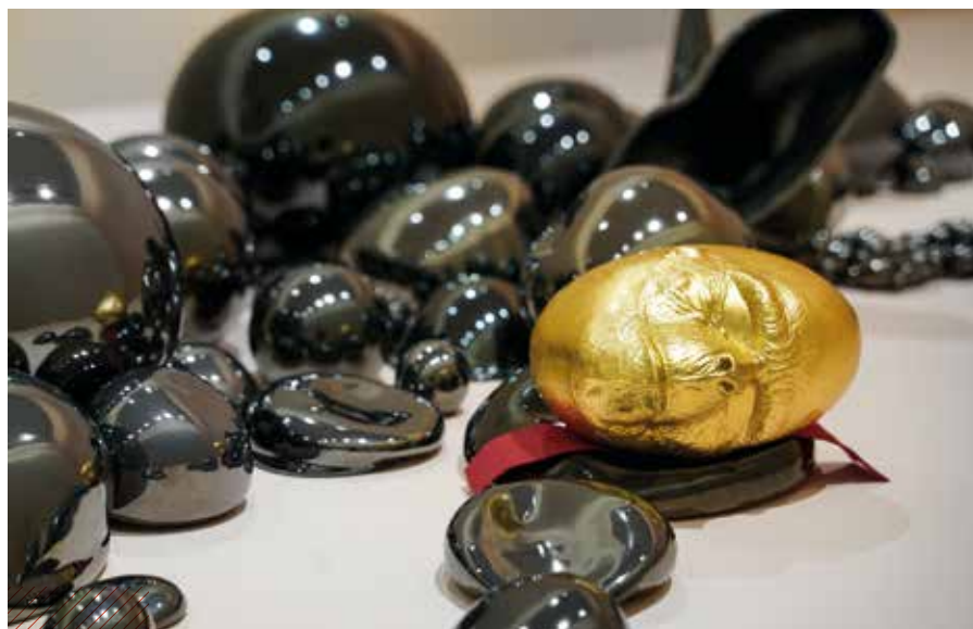
Naturaleza muerta con perlas negras (2002)