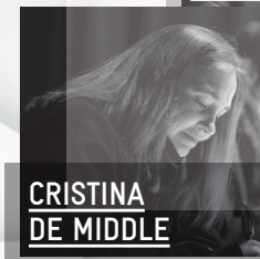
CRISTINA DE MIDDLE