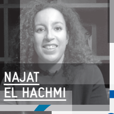
NAJAT EL HACHMI