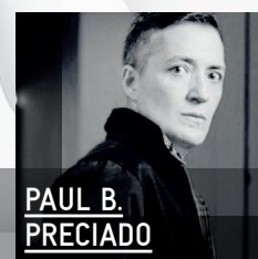
PAUL B. PRECIADO