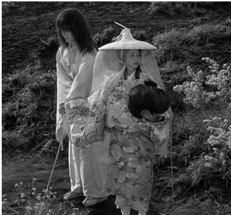
© Ran, 1985. Akira Kurosawa © 1985 StudioCanal, París/Herald Ace Inc.-Nippon Herald Films Inc., Tokio

Como Kagemusha , Ran está ambientada en el período Azuchi Momoyama [1568-1603], una época de renacimiento japonés, y cuyo nombre proviene del castillo Azuchi del señor Nobunaga. Durante este período Japón se abrió al mundo exterior a través del comercio y se desarrollaron los grandes centros urbanos, en los que floreció una nueva clase mercantil que impuso una estética visual mucho más sofisticada, en contraste con la sobriedad del período anterior dominado por las guerras feudales.