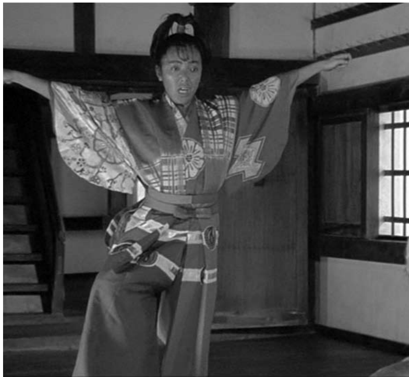
Ran, 1985. Akira Kurosawa

Kagemusha bezala, Ran filma Azuchi Momoyama epealdian [1568-1603] dago girotuta. Garai horretan, Japonia berpiztu egin zen, eta Nobunaga jaunaren Azuchi gaztelutik datorkio izena. Epealdi horretan, Japonia kanpoko mundura ireki zen merkataritzaren bitartez, eta hirigune handiak garatu ziren. Bertan, hain zuzen ere, merkataritza-arloko gizarte-maila berria sortu zen, eta are sofistikatuagoa zen ikusizko estetika inposatu zuen, gerra feudalen eraginpeko aurreko epealdiko soiltasunaren aldean.