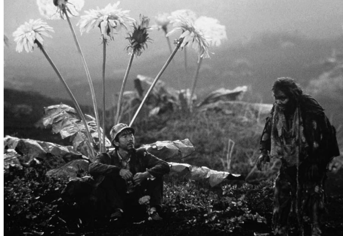
Akira Kurosawaren ametsak, 1990

Adibidez, hurrengo eszena, hots, Lady Kaedek bere koinatua [Jiro] klan berriko lider bezala aurkezten duenean batailan zendutako bere senarraren [Taro] kaskoa entregatzen dion bitartean, hainbat astez prestatu behar izan zen. Izan ere, alde zuzenetik, aktoreari mugimendu bakoitzaren zentzua irakatsi zitzaion, bere keinuetako bakoitza modu perfektuan menperatzeko.