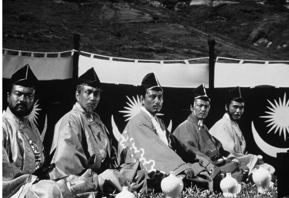
Ran, 1985

Nola lagundu zuen Kurosawak samurai kultura hedatzen? Erreparatu samuraiaren janzkerari... filmen bat ekartzen dizu gogora? Zer-nolako antzekotasunak ikusten dituzu janzkera honen, armen eta Izarretako Gerraren [Stars Wars] pertsonaien artean? Jedi zaldunek eta Kurosawaren samuraiek antza daukate?