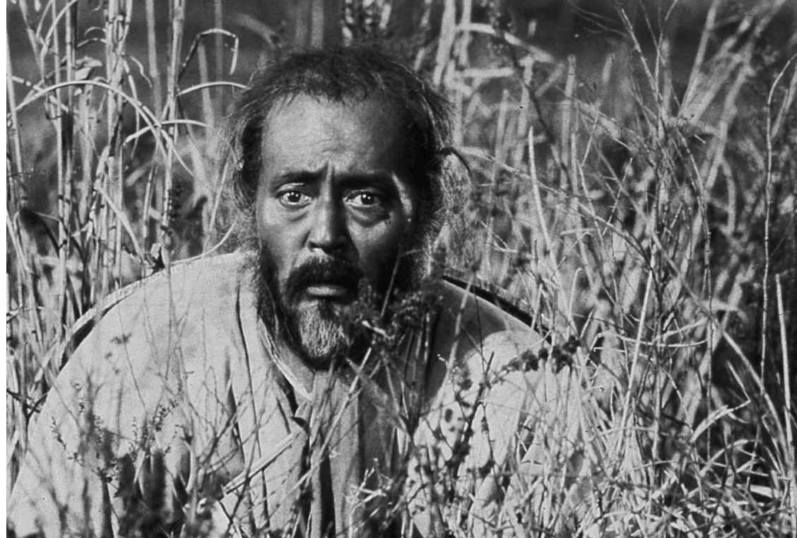
Kagemusha, gerlariaren itzala , 1980

Akira Kurosawak esaten zuenez, nola edo hala harrapatu behar zituen «enkladratzea, pertsonaien psikologia eta emozioak, haien mugimenduak, kameraren angelu egokia mugimendu horiek hartzeko, argiteria, jantziteria eta osagarriak [...]. Aurrez hausnarketa egin ez badut osagai horietako bakoitzari buruz, ezin dut eszena marraztu».