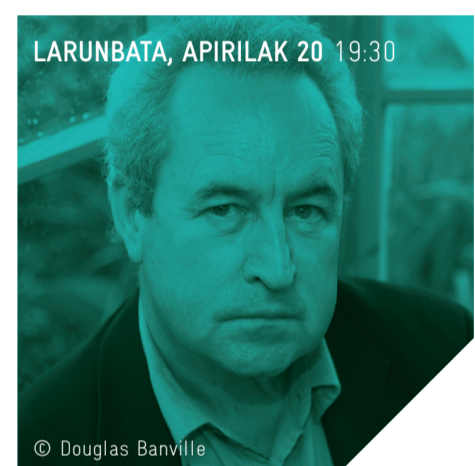
LARUNBATA, APIRILAK 20 19:30

Iñaki Esteban kazetaria, lehenbiziko edizio-tik Gutun Zuriaren aholkularia izan dena, solasean arituko da John Banvillerekin. Banvillek, Frank Kafka 2011 saria irabazi du eta hitzen zale amorratua da. Bere eleberrien artean, hauek nabarmen dira: 'The Untouchable' , 'Eclipse' , 'Shroud' eta 'The Infinities' . Benjamin Black izengoitiaz, lan hauek argitaratu ditu Alfaguaran: irakurleen eta kritikaren aldetik arrakasta handia izan duen 'The Lemur' (2009), eta 'Quirke' pertsonaia nagusi gisa duen nobela beltzeko saila, aurki Britainia Handiko BBCk telebistan aurkeztuko duena. 'Ancient Light' da gogo handiz itxaron dugun bere azken eleberria.