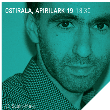
OSTIRALA, APIRILAK 19 18:30