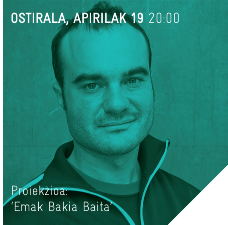
OSTIRALA, APIRILAK 19 20:00

Oskar Alegría kazetaria da lanbidez, eta kulturako programak idazten eta literaturari eskainitako guneak koordinatzen aritu da. 2002. urtetik hona, El País egunkariko El Viajero gehigarrian idazten du, eta 'Las ciudades visibles' izeneko argazkigintzako proiektu artistikoa landu du.