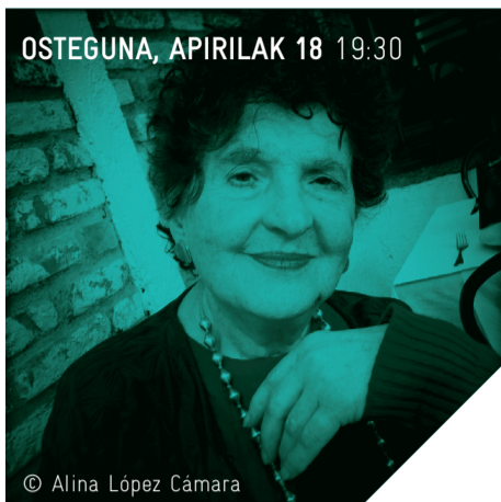
OSTEGUNA, APIRILAK 18 19:30