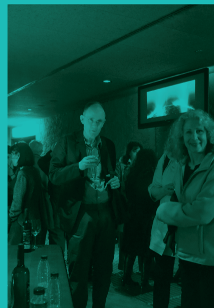
Auditoriumeko atartean. -1. solairua Sarrera dohainik, hitzaldira joaten diren lagunentzat bakarrik

Gutun Zuriaren edizio honetan, ardo bakan bat hautatu dugu bilera honi laguntza emateko, La Bodega Urbana de Bilbaoko enologoek abagune honetarako bereziki prestatu dutena. Ardo freskoa, biribila eta gozoa da. Ardo atsegina, irakurketari beste gozamen bat eskaintzen diona.