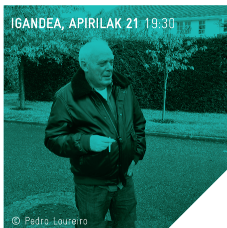
IGANDEA, APIRILAK 21 19:30