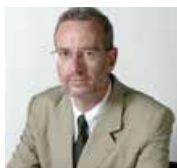
Llätzer Moix (Sabadell, 1955)

Idazlea eta kazetaria. 'Arquitectura milagrosa' (2010) lanaren egilea. Escritor y periodista. Autor de 'Arquitectura milagrosa' (2010).