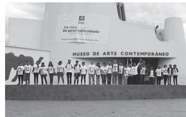
Escuela de garaje Vol. Común