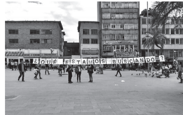
Escuela de garaje Vol. Intemperie

La curaduría pedagógica es una idea que busca volver culturalmente activo el arte: uniendo el potencial de la educación y lo curatorial para cuestionar, por medio de un complejo sistema de acciones y estrategias que desbordan la exposición, diferentes relaciones de poder en instituciones del arte y la cultura. Un proceso que muchas veces es invisible y cuyos resultados funcionan a largo plazo.