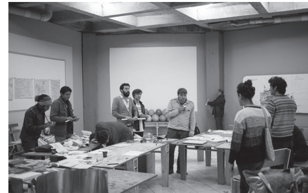
Escuela de garaje / Fábrica de conocimiento